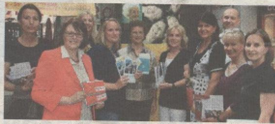
Landeshauptfrau Gabi Burgstaller und Vertreterinnen der Frauenorganisationen im EKZ KARO in Bischofshofen.

Vergangene Woche endete die Infoaktion „Für Frauen im Pongau“, initiiert von der Stabsstelle für Frauenfragen und Chancengleichheit mit dem Besuch von Landeshauptfrau Gabi Burgstaller in Bischofshofen.