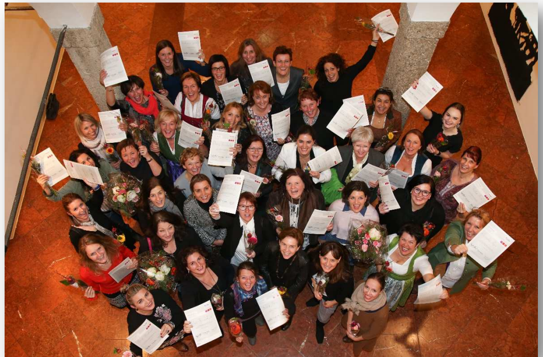
Zertifikatsübergabe Politiklehrgang „Frau gestaltet mit“ in Salzburg am 12.12.2017

1998 Gründung und seit 2012 vom Bund anerkannte Frauenservicestelle für den Pongau und Pinzgau